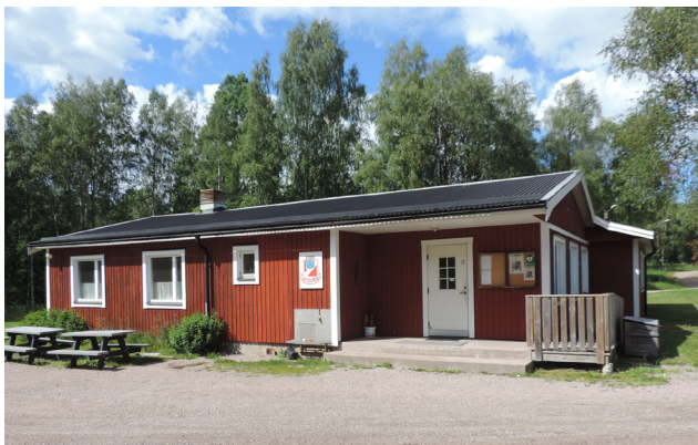
NOK-STUGAN. Vår fina klubbstuga i Nordansjö.