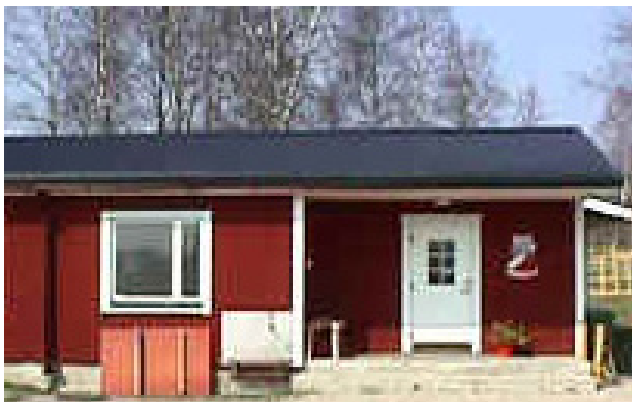
NOK-STUGAN. Vår fina klubbstuga i Nordansjö.