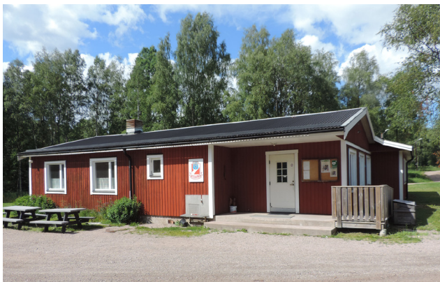
NOK-STUGAN. Vår fina klubbstuga i Nordansjö.