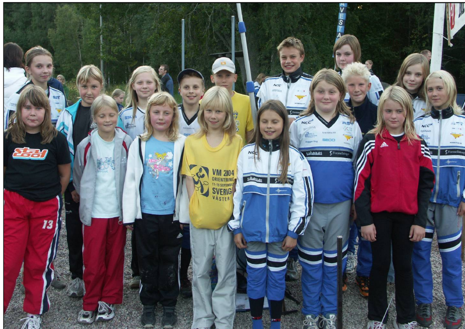
Ett framgångsrikt NOK-gång i Avesta 3-dagars

Grattis alla duktiga deltagare Tack alla skuggor och föräldrar!