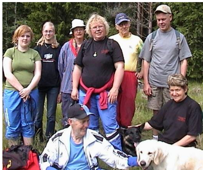
Ett glatt vandring under en paus

Från Digerkällan fortsatte promenaden österut på en fin gammal skogsstig som faktiskt klarat sig utan att förstöras av skogsavverkning. Slutligen kom vi fram till den gamla Lapphyttan, den som har fått en rekonstruktion