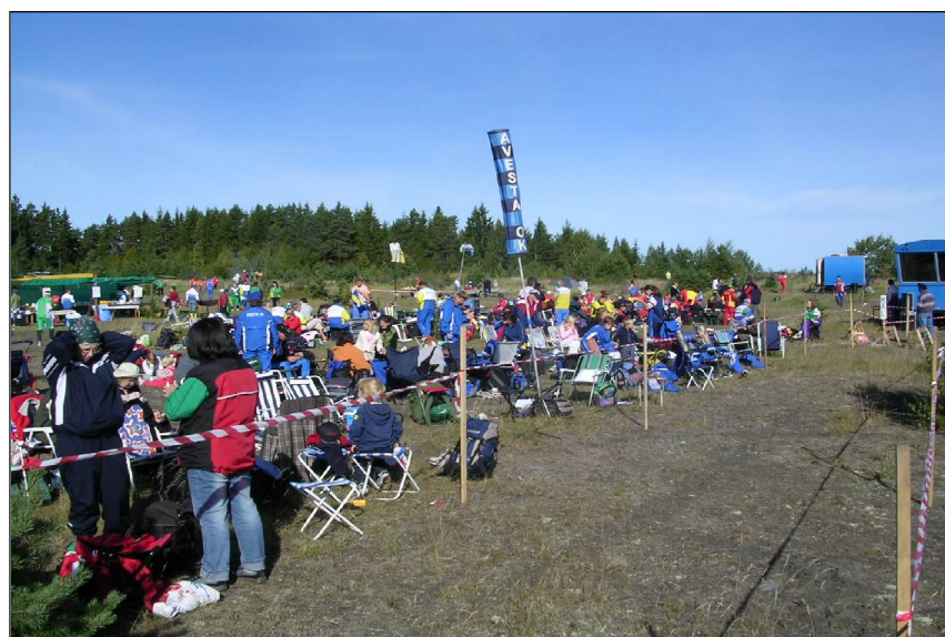
NOK:s Nationella hade en härlig målplats på Romtjärnsdammen