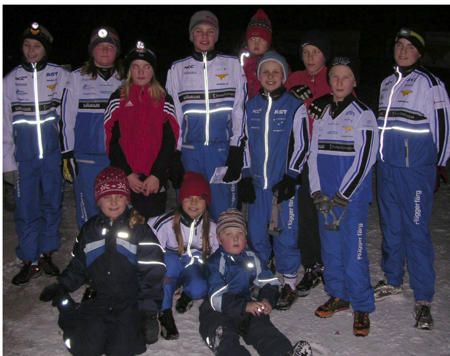
Ett gäng pigga NOK-ungdomar återsamlade efter ett träningspass i höstmörker och snö en tisdagväll i början av december.